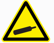
غاز تحت الضغط